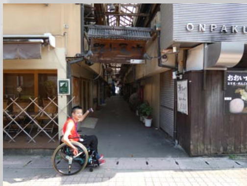
日本最古の木造アーケード【竹瓦小路】

やよい商店街アーケード内に「やよい天狗神輿」はある。昭和48年に火災厄除けと温泉感謝の意を込めて創作された。別府では春の訪れを祝う「別府八湯温泉まつり」が毎年開催されるが、そのお祭りの中で、メインとなるお神輿として街中を練り歩く。写真撮影ポイントとしてもおすすめ!